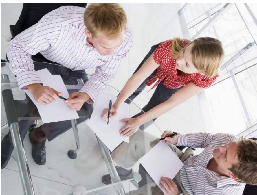
Tillsammans med Mittmedia och Sundsvalls Kommun storsatsar mässan återigen inför 2019